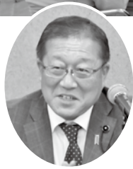
講師 中村県議会議員