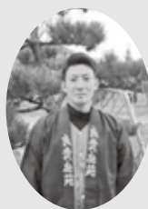
株式会社 良貴庭苑