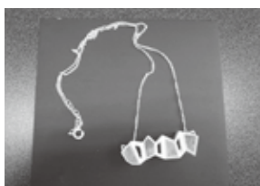
蘇ユナさんの作品 FLAT ペンダント