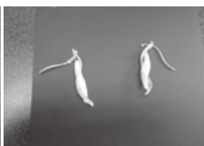
門田眞乃さんの作品 Knew ピアス